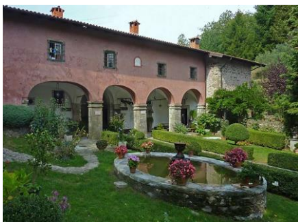
Eremo Madonna del Soccorso-Minucciano

La dorsale che separa la Lunigiana dalla Garfagnana ospita alcuni dei luoghi di culto più frequentati dalle popolazioni di entrambe le vallate. Collegarli con un percorso escursionistico vuol dire effettuare un lungo itinerario che ha nei boschi di castagno, cerro e, in misura minore, pino i suoi indiscussi protagonisti. Infatti la copertura arborea accompagna per tutta la tranquilla escursione e, in pratica, si può dire che si esce da questa solo per entrare nel grande prato che circonda il Santuario della Madonna della Guardia all'Argegna.