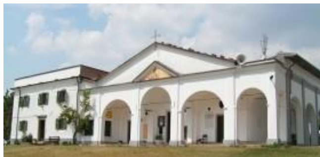
Santuario della Madonna della Guardia all'Argegna