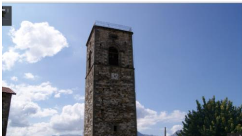
Campanile della Chiesa di Sant'Antonino

La chiesa di Varliano dedicata a San'Antonino Martire , è caratterizzata da linee semplici. Costruita in pietra, reca sul portale la data 1757, a ricordo di una fase di restauro che comprese anche la decorazione delle pareti e del soffitto. All'interno custodisce notevoli arredi fra i quali una tela della seconda metà del seicento, raffigurante una "Madonna in trono e Santi". E' dotata di una grandiosa torre campanaria sul piazzale circostante.